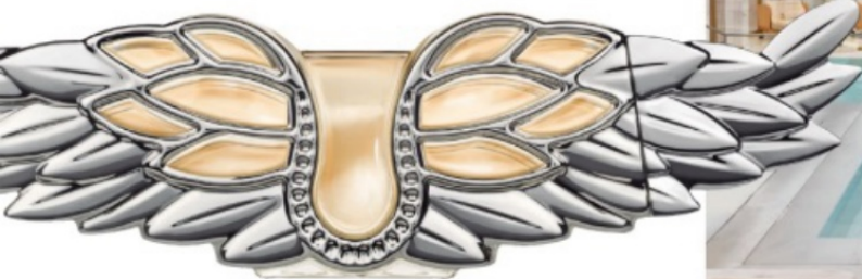
"Here I come. It's my time to fly", el eslogan en busca de la libertad de Zadig eau de parfum (105 € / 50 ml).