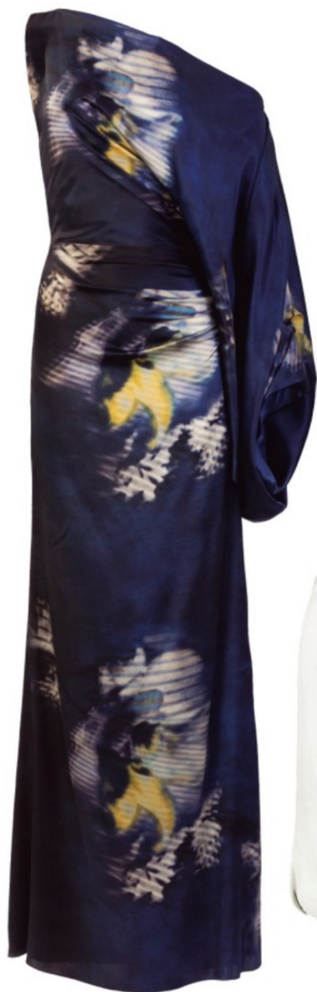
Vestido Dotty con escote asimétrico y estampado Midnight Flower de Silvia Tcherassi.