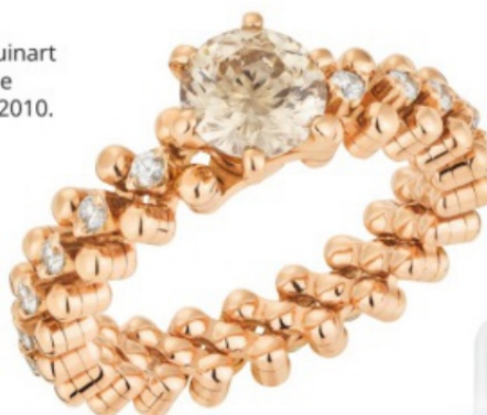
Serafino Consoli x WEMPE-Cut®. Anillo solitario en oro rosado con un diamante y 21 brillantes (14.990 €).