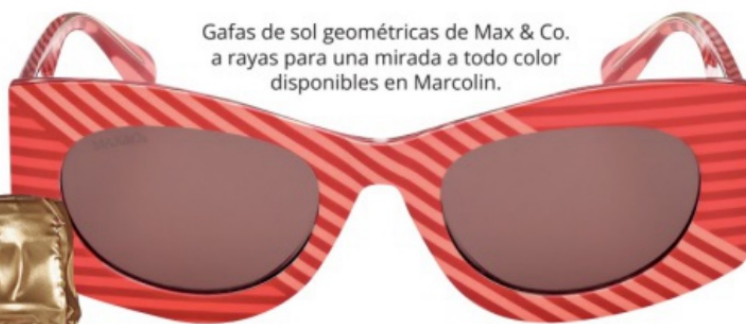
Gafas de sol geométricas de Max & Co. a rayas para una mirada a todo color disponibles en Marcolin.