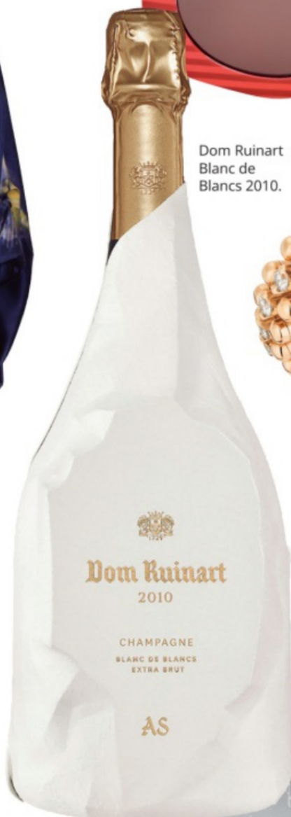
Dom Ruinart Blanc de Blancs 2010.