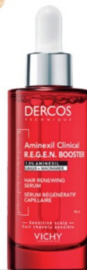
DERCOS sérum capilar Aminexil Clinical R.E.G.E.N. BOOSTER de Vichy (37,95 € en Primor).