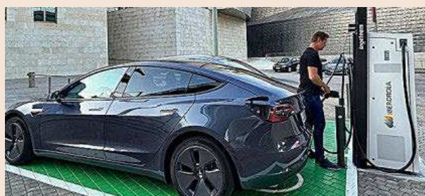
Siete mil puntos de recarga no han recibido aún autorización.

Los precios se moderan al 1,5% en septiembre