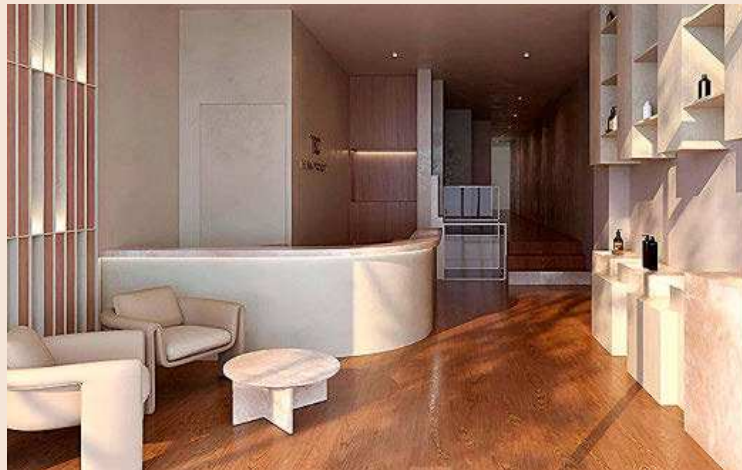
TBC Medical es el nuevo centro de The Beauty Concept, en Ortega y Gasset.

Con el pelo, mejor cortar por lo sano y/o recurrir al protocolo bestseller en esta época del año: Bae Berry, de Goa Organics. "Un tratamiento que hacemos en TBC Hair con una acción rápida de reconstrucción que reduce el daño producido en la fibra capilar por procesos de decoloración, falta de cuidado o el proceso