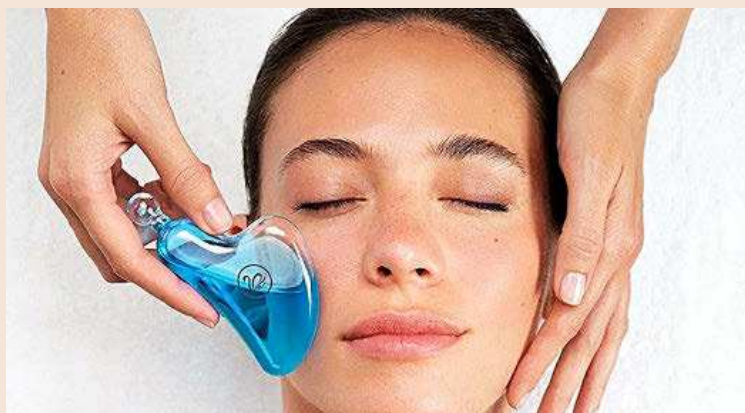
Desde Germaine de Capuccini recomiendan el ácido hialurónico para hidratar.

Y si aún le dura el síndrome posvacacional, en su agenda de bienestar debe subrayar Mind Oasis by Rituals, en Barcelona, que ofrece un masaje mental en un sillón de gravedad cero a través de respiración guiada, sonidos 4D, terapia lumínica y vibraciones hápticas. Lo llaman sincronización de ondas cerebrales. Y es que como concluye Garcíaño, "hay que escuchar lo que nuestro cuerpo [y nuestra mente] nos pide".