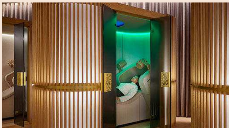
En Mind Oasis by Rituals, en Barcelona, ofrecen masajes mentales.