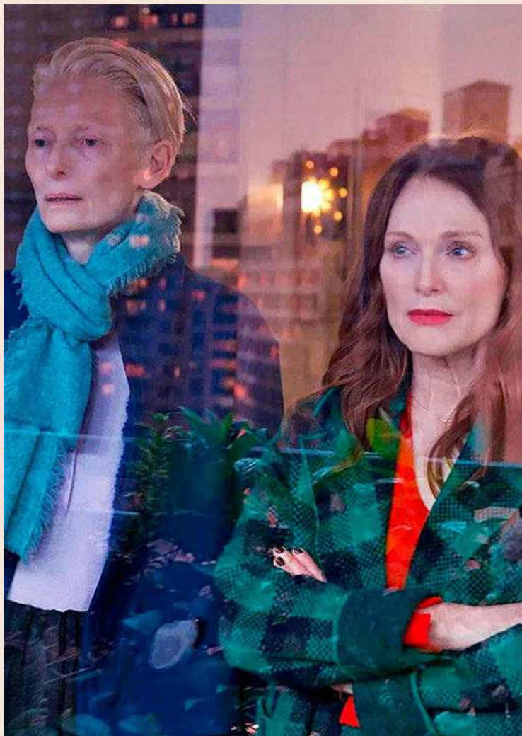
'La habitación de al lado', la nueva película de Almodóvar con la que obtuvo el León de Oro en el Festival de Venecia el pasado mes de septiembre.

La habitación de al lado culmina ese proceso parcialmente ya que aunque la ha filmado en inglés, es una película rodada, previsiblemente, bajo el paraguas familiar de su productora El Deseo, filmada a caballo entre Madrid y Nueva York y con dos actrices de gran calado: Tilda Swinton, convertida en algo así como su musa, a la que le ofreció el personaje protagonista, prácticamente un monólogo, de La voz humana , y a la que acompaña esa gran actriz que es Julianne Moore. La película adapta la novela, Cuál es tu tormento escrita por Sigrid Nunez. Si bien el cineasta ha confesado que en la película queda poco del origi-