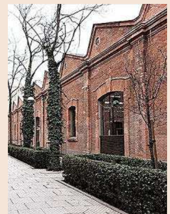
Real Teatro de Retiro.