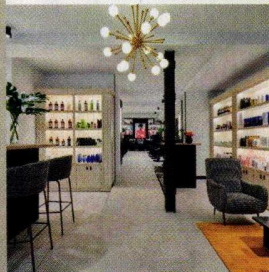
Arriba: Interior de Le Secret . Izquierda: la fundadora de Philocalist Studio y el centro de belleza The Beauty Concept .

o la belleza. También es un enclave donde se apoya a artistas de diferentes ámbitos. Philocalist también es pura inspiración, y hemos pedido a sus cuatro socias (y amigas) que desvelen a ¡HOLA! MADRID sus rincones favoritos de la capital.