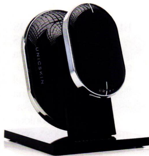
Dispositivo corporal de Unicskin.

UNA INVERSIÓN QUE MERECE LA PENA La alternativa a los inyectables y con resultados 100% naturales ya está aquí: Thermage FLX, que, según el doctor Tufet, «es la mejor inversión para tu piel a partir de los 35 años». Diseñado para revertir la flacidez en una sola sesión al año y con resultados visibles desde el primer momento, tanto a nivel facial como corporal. ¿Dónde? En Thermage Clinic (Conde de Aranda 15, Madrid).