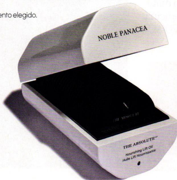
Izq., 'The Absolute Nourishing Lift Oil' (367 €), tratamiento facial nutritivo en monodosis de Noble Panacea. Dcha., 'Orchidée Impériale Esencia-Loción Concentrada' (180 €), de Guerlain.