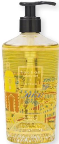
Gel de ducha Baobab Collection SAINT TROPEZ (55 €).

Es tiempo de aperitivos y chiringuitos. Los nutricionistas recomiendan sustituir las patatas fritas por encurtidos como pepinillos o cebolletas, que son fuente de antioxidantes, nueces o avellanas.