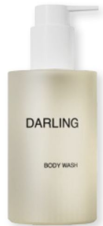
Body Wash, DARLING (39 €), acelera el bronceado.

No hay nada más placentero después de la playa que una ducha holística, con geles tonificantes y relajantes, de aromas exquisitos, que hidratan y cuidan el microbioma de la piel... Lo último: un gel que prolonga el bronceado y estimula la melanogénesis, gracias a la tirosina.