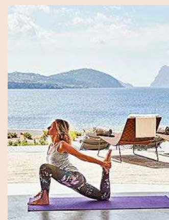
Yoga frente a Es Vedrà.

¿Por qué no regalar una clase de yoga por el Día de la Madre? Y si además es privada y con vistas a Es Vedrà, la cuadratura del círculo es total. El Pure Seven Spa, que encarna el espíritu relajado y elegante de 7Pines Resort Ibiza, es el lugar de 1.500 metros cuadrados donde se realizan clases como la citada, además de meditación guiada. También hay tratamientos relajantes y revitalizantes y no es necesario ser huésped.