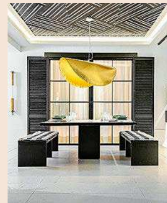
La feria MIAD aunarà arte, diseño y arquitectura en la plaza de Las Ventas.