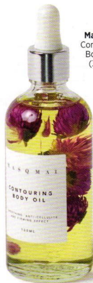
Masqmal Contouring Body Oil (36 €).

Deshidratación, manchas, finas líneas, flacidez... Los estragos del verano no solo se reflejan en el cutis, la piel del cuerpo fotoenvejece de la misma forma. Por eso, en otoño, lejos de relegar esta zona a un segundo plano, debemos mimarla con productos ricos en ingredientes de propiedades ultrarreparadoras y tónicas.