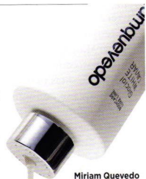
Miriam Quevedo Glacial White Caviar Revitalizing Body Cleansing Balm (50 €).

El ritual Mediterranean Breeze supone una experiencia única. Miriam Quevedo fusiona a la perfección el rejuvenecimiento facial y la remodelación corporal de Glacial White Caviar. Sensorial y maravilloso ( mandarinoriental.es/barcelona , 280 €).