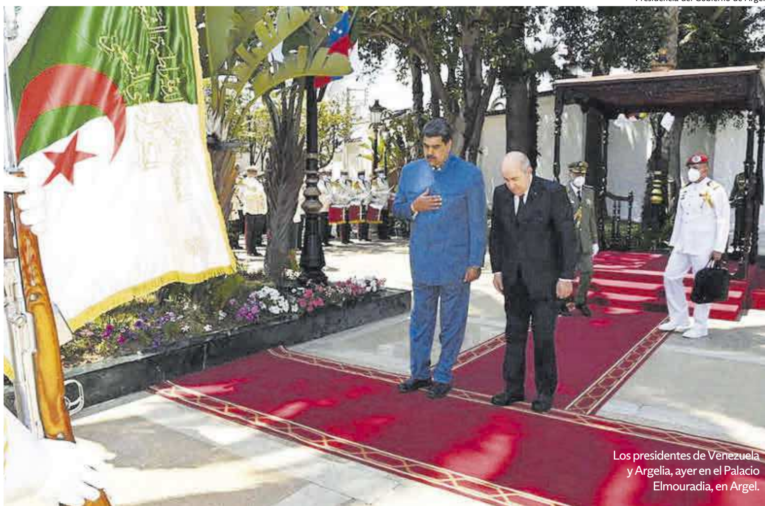
Los presidentes de Venezuela y Argelia, ayer en el Palacio Elmouradia, en Argel.

Maduro, en suelo argelino. El presidente de Venezuela, Nicolás Maduro –que no ha sido invitado a la Cumbre de las Américas que se está celebrando en Los Ángeles (EEUU)–, realiza una visita de dos días a Argelia, el país que está en plena crisis diplomática con España. De hecho, el presiden-