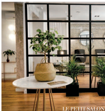
LE PETIT SALON

Navarro Reverter 11, Valencia. Almagro 15, Madrid.