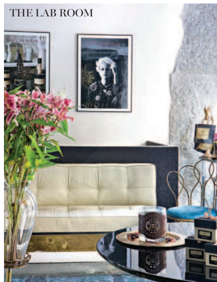
THE LAB ROOM

Además de mejorar el estado de tu piel, disfrutarás de un momento de DESCONEJÓN.