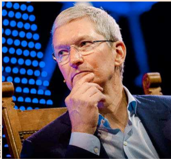
Tim Cook, consejero delegado de Apple.